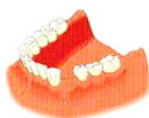
歯を1本失った場合

失われた歯の数、インプラントを埋め込む骨の硬さ、大きさ、位置により、治療法には様々な選択肢があります。歯にかかる力の方向や強さはもちろん、患者さんに無理のない衛生管理などを含め総合的に検討した上で、治療計画が立てられます。