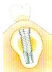
仮歯を使用する例

一次手術後、3～6カ月の治癒期間をおくことで、インプラントと骨が強い力で結合します（オッセオインテグレーション）。この期間、仮の歯を使用できる場合もあります。