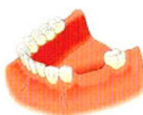
歯を何本か失った場合