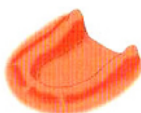
歯を全部失った場合